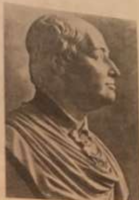
Ил. 93. Бюст М. В. Ломоносова. Ск. Ф. Шубин. Русский музей

(1740–1805) — сын поморского костолома. В 19 лет, овладев искусством отца, отправился в Петербург. Благодаря поддержке М. В. Ломоносова и И. И. Шувалова он устроился истошником в Академию художеств и одновременно посещал занятия. По окончании Академии был отправлен в Париж, побывал в Италии и Англии. Достиг совершенства в обработке мрамора, в создании бюстов. Это он создал галерею скульптурных портретов вельмож, а также известных деятелей. Оформил барельефами Мраморной и Чесменский дворцы, Троицкий собор Александро-Невской лавры. К концу правления Екатерины II мода на скульптурные портреты прошла. Шубин жил в ветхом деревянном доме на Васильевском острове. У него была большая семья, но не было жалованья, пенсии, учеников.