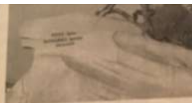
Ил. 94. Медный всадник

долбили у них середину. В эти желоба положили бронзовые шары. На них передвинули камень и... потащили гигантский валун. В желоба подливали воду, чтобы от трения не загорелось дерево. На камне сидели каменотёсы, которые по ходу обрабатывали гранит.