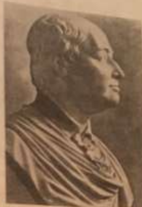
Ил. 93. Бюст М. В. Ломоносова. Ск. Ф. Шубин. Русский музей

(1740–1805) — сын поморского костолома. В 19 лет, овладев искусством отца, отправился в Петербург. Благодаря поддержке М. В. Ломоносова и И. И. Шувалова он устроился истошником в Академию художеств и одновременно посещал занятия. По окончании Академии был отправлен в Париж, побывал в Италии и Англии. Достиг совершенства в обработке мрамора, в создании бюстов. Это он создал галерею скульптурных портретов вельмож, а также известных деятелей. Оформил барельефы в Мраморной и Чесменский дворцы, Троицкий собор Александро-Невской лавры. К концу правления Екатерины II мода на скульптурные портреты прошла. Шубин жил в ветхом деревянном доме на Васильевском острове. У него была большая семья, но не было жалованья, пенсии, учеников.